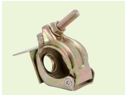
自在タル木止めクランプ48.6