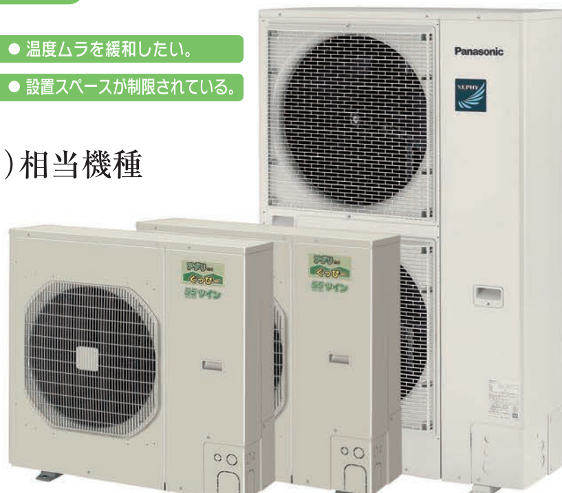
ハウス内ユニット(室内ユニット) CS-P112AG3×2