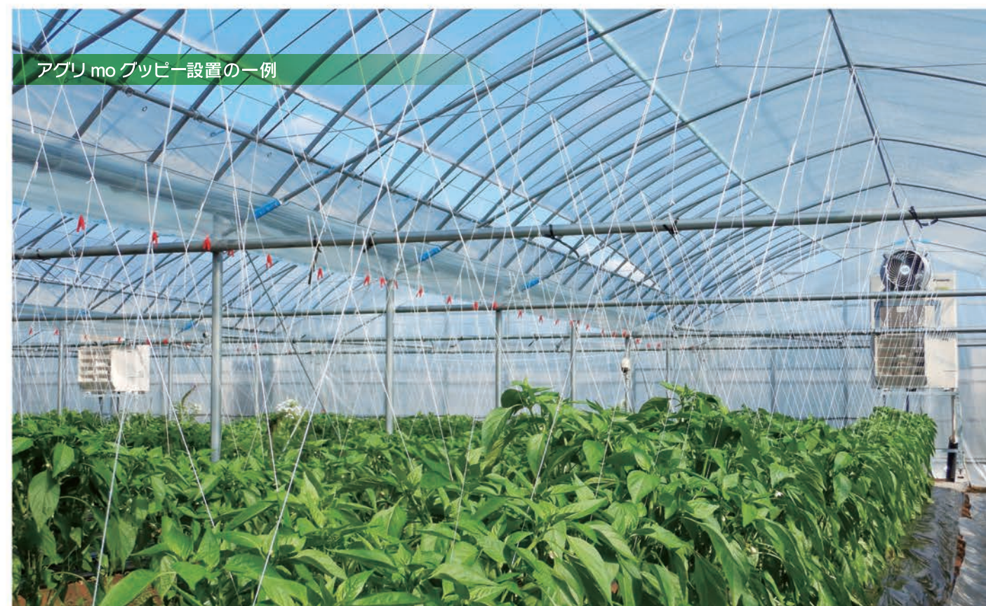
アグリmoグッピー設置の一例

※JIS条件による 暖房定格運転時(室外7℃室内20℃) 冷房定格運転時(室外35℃室内27℃)