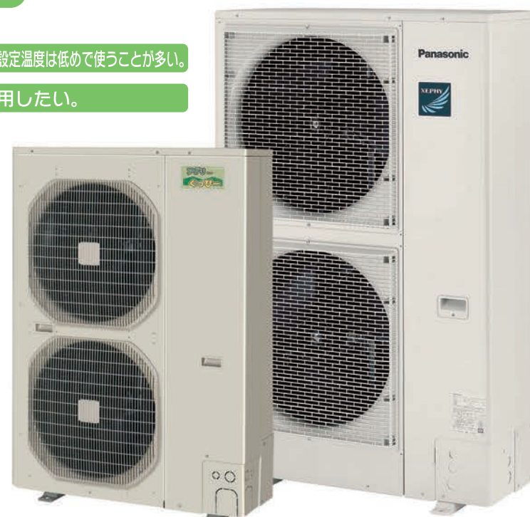
ハウス内ユニット(室内ユニット) CS-P180AG3