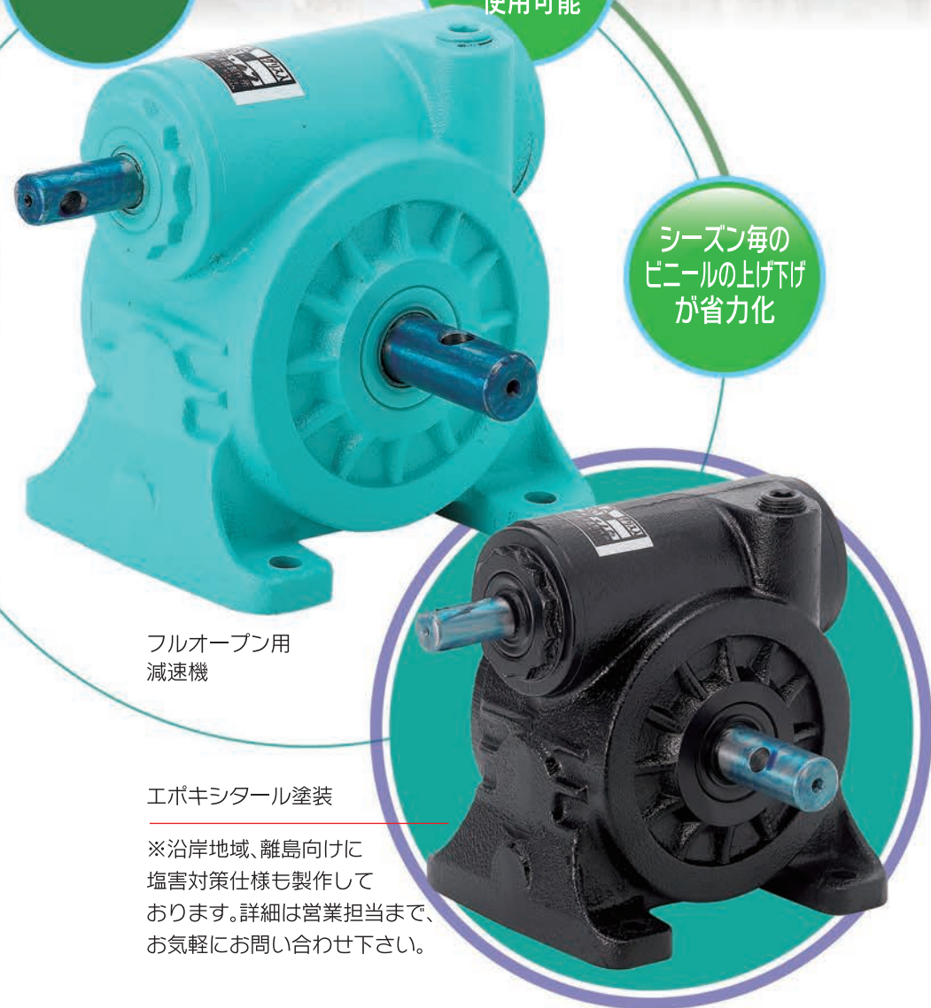
フルオープン用減速機